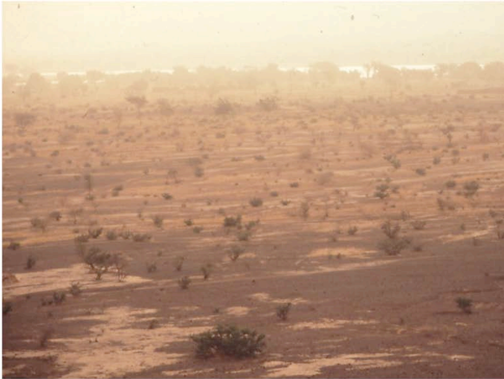
Harmattanstaubtransport im Nigertal bei Niamey (SW-Niger)