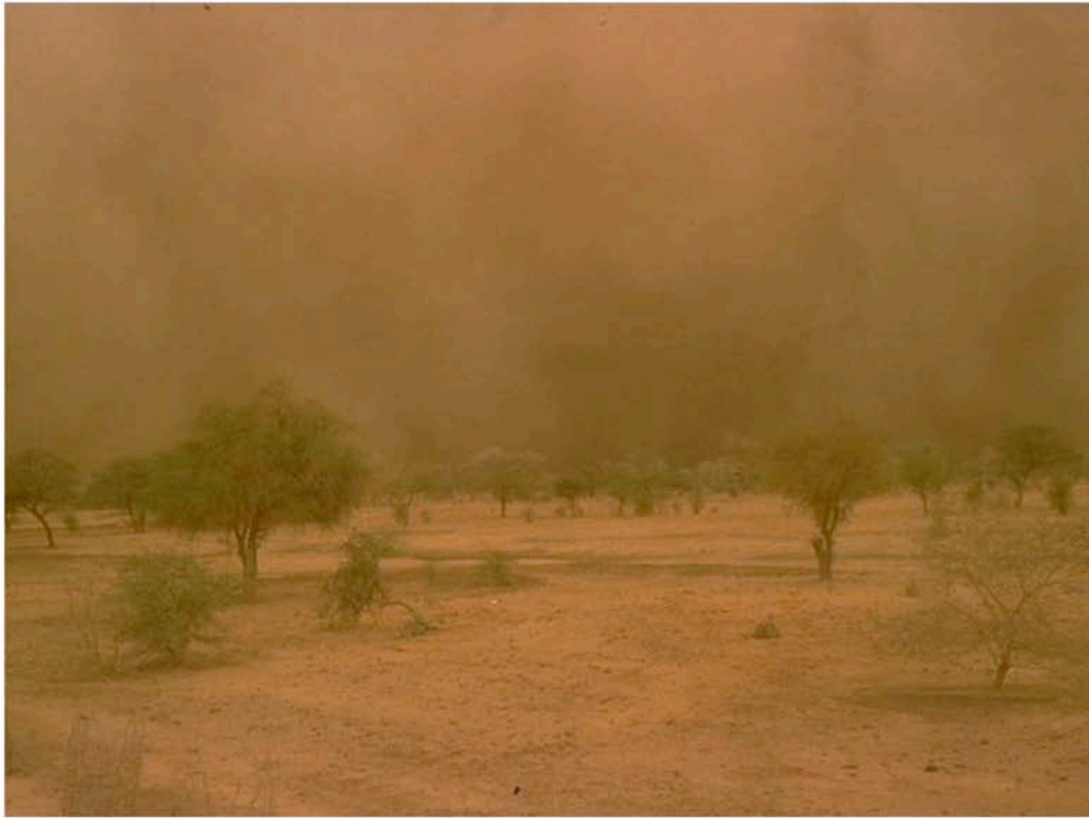
Der Sturm