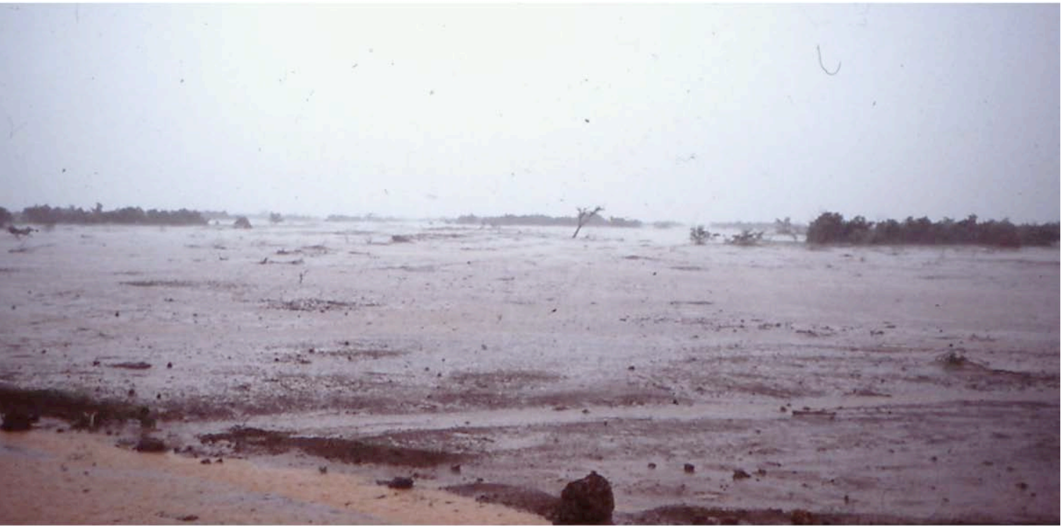
Starkregen und Oberflächenabfluß mit Sedimenttransport