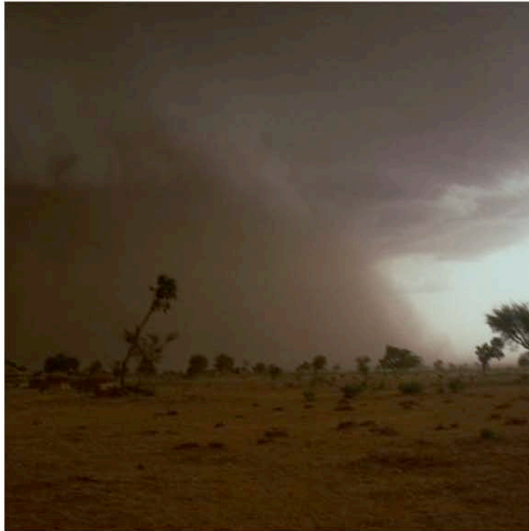
Ankunft eines konvektiven Sturms in SW-Niger