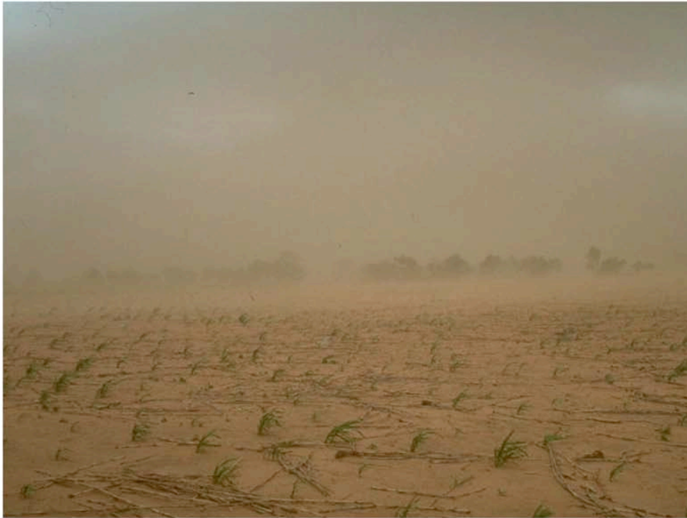
Sandtransport nahe der Oberfläche während eines konvektiven Sturms im Sahel